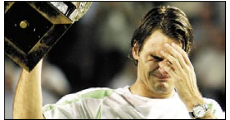
Roger Federer - met beker en sponsorhorloge - in tranen.

MELBOURNE - Met z'n 24 jaar staat Roger Federer al op zeven Grand Slam-kruisjes. Maar zijn gevoelens beheerste hij niet.